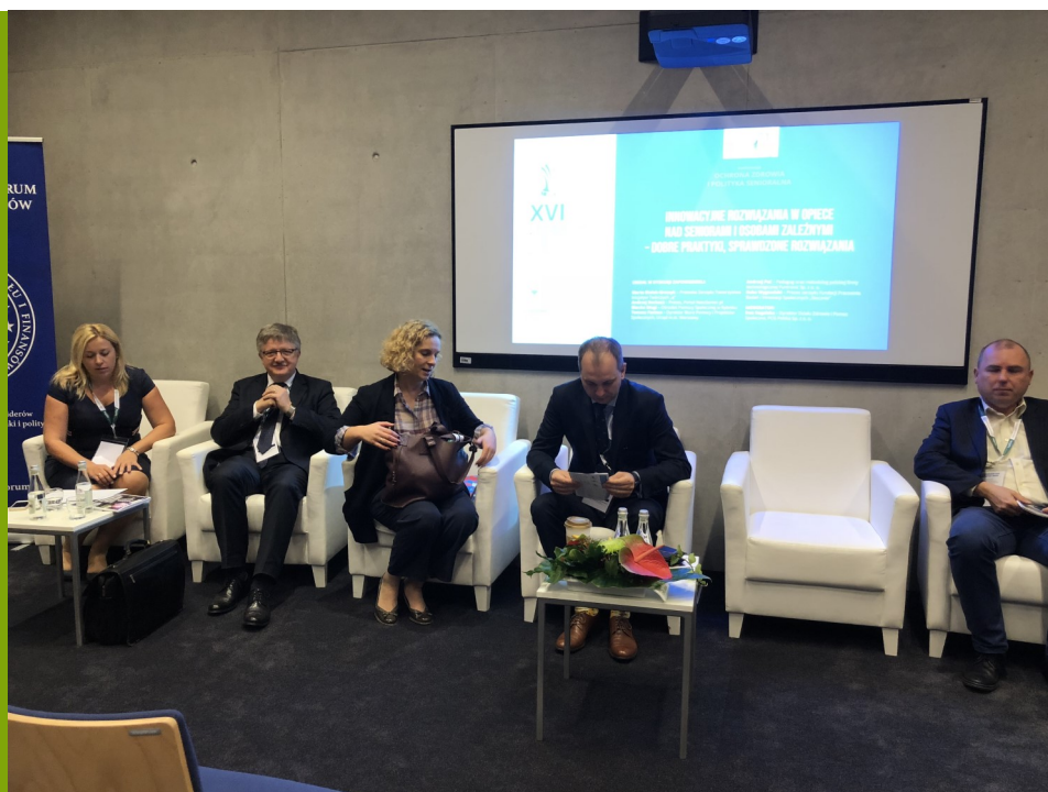
Panel - Innowacyjne rozwiązania w opiece nad seniorami i osobami zależnymi

W zależności od grupy docelowej specjaliści nadzorują funkcjonowanie osoby skierowanej do mieszkania chronionego. Dają podopiecznemu wskazówki, porady, towarzyszą przy wykonywaniu zwykłych codziennych obowiązków, uczą planowania budżetu i wydatków domowych, dbałości o własne sprawy.